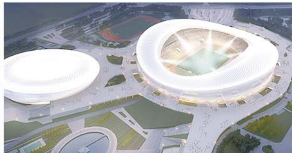
青岛市民健身中心。