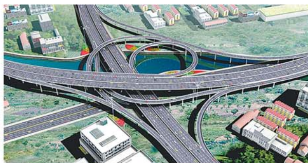
青岛胶州湾大桥(北桥位)青岛段接线工程(四标段)。