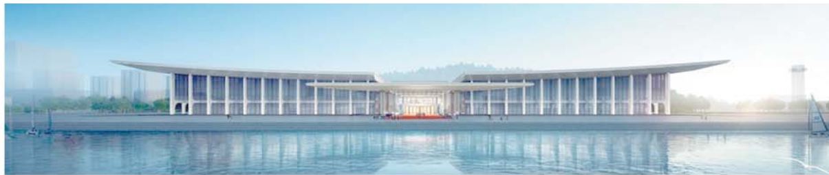
青岛国际会议中心工程(上海合作组织青岛峰会主会场)。